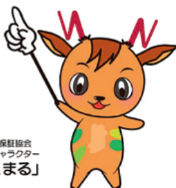
奈良県信用保証協会 マスコットキャラクター 「ほしよまる」