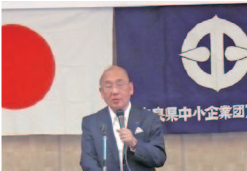
奈良県 荒井正吾知事