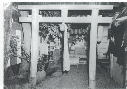
いにしえの理源大師堂と辨財天