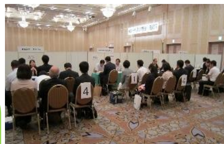
(H29年 ホテル日航奈良)